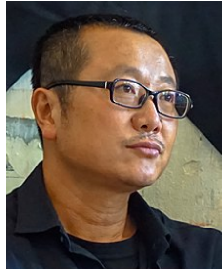
Liu Cixin (2015)

Liu ist neunfacher Galaxy-Award-Gewinner und war 2015 Preisträger des renommierten Hugo-Awards für den besten Science-Fiction-Roman. [2]